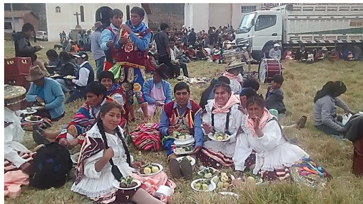
Jugendliche aus unserer Partner-Pfarrgemeinde Chacan